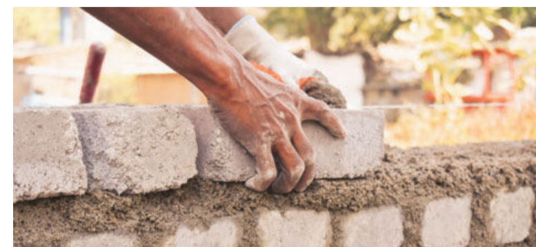
BIS has requested state governments to use bricks made of fly ash instead of traditional ones

These aim to reduce impact of human activity and promote efficient use of resources